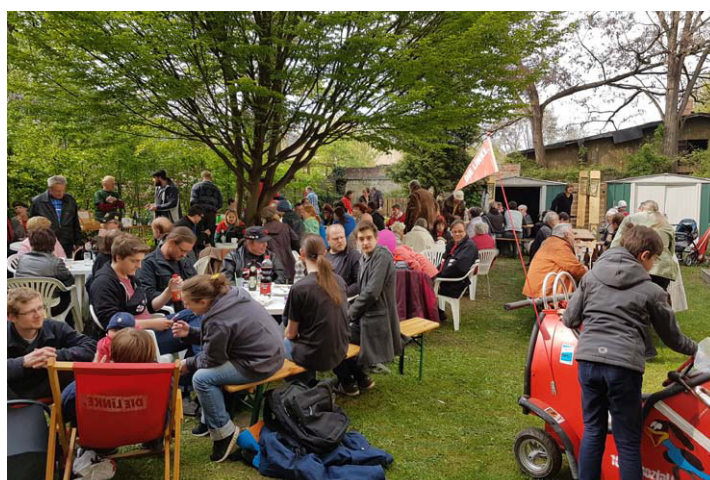
Bild rechts unten: 1. Mai, die Zweite. Beim traditionellen Hoffest kamen zahlreiche Genoss*innen im Hof des Liebknecht-Hauses zusammen und ließen den Internationalen Kampf- und Feiertag der ArbeiterInnenklasse gemeinsam ausklingen.