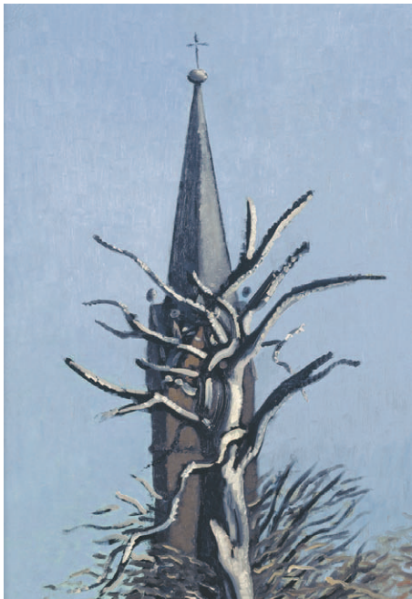
Wolfgang Mattheuer, »Kirchturm und Buche«, 1989, Öl auf Hartfaser, 70 x 50 cm

Fazit: Eine würdige Werkschau. Nicht verpassen! D.M.