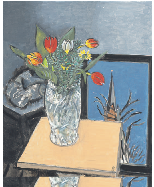
Wolfgang Mattheuer, »Stilleben im Atelier«, 2002, Acryl auf Sperrholz, 100 x 80 cm

Zum wiederholten Male stand die Radsportlegende Gustav-Adolf Schur vor den Toren der sogenannten »Hall of Fame« des deutschen Sports. Einlass wurde erneut nicht gewährt.