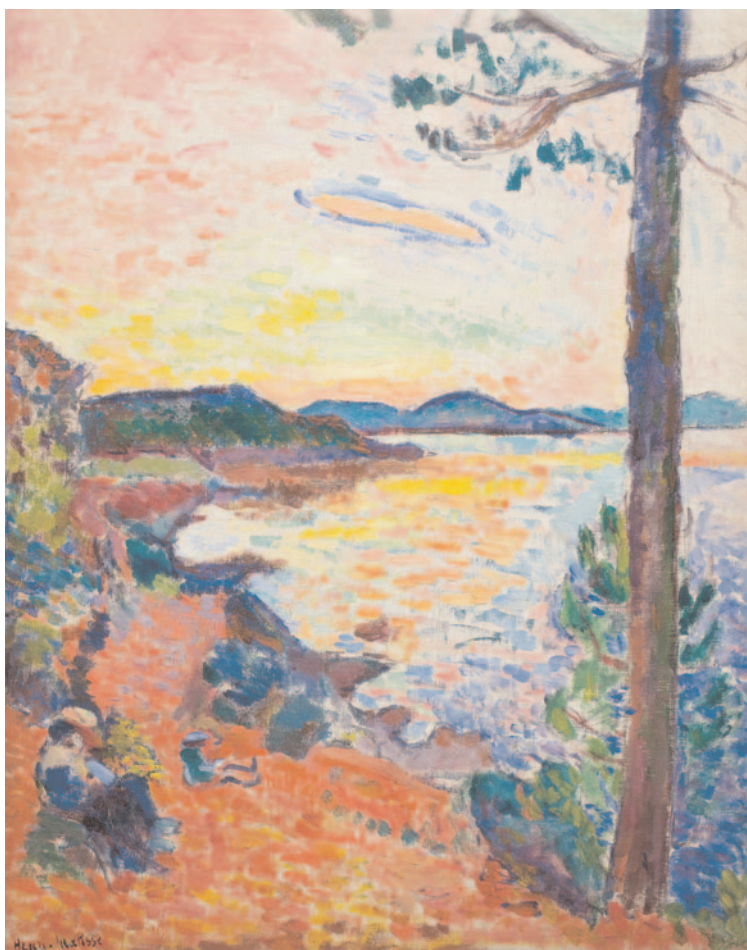
Henri Matisse (1869 - 1954), »Die Bucht von Saint-Tropez«, 1904, Öl auf Leinwand, 65 x 50,5 cm, Kunstsammlung Nordrhein-Westfalen, Düsseldorf