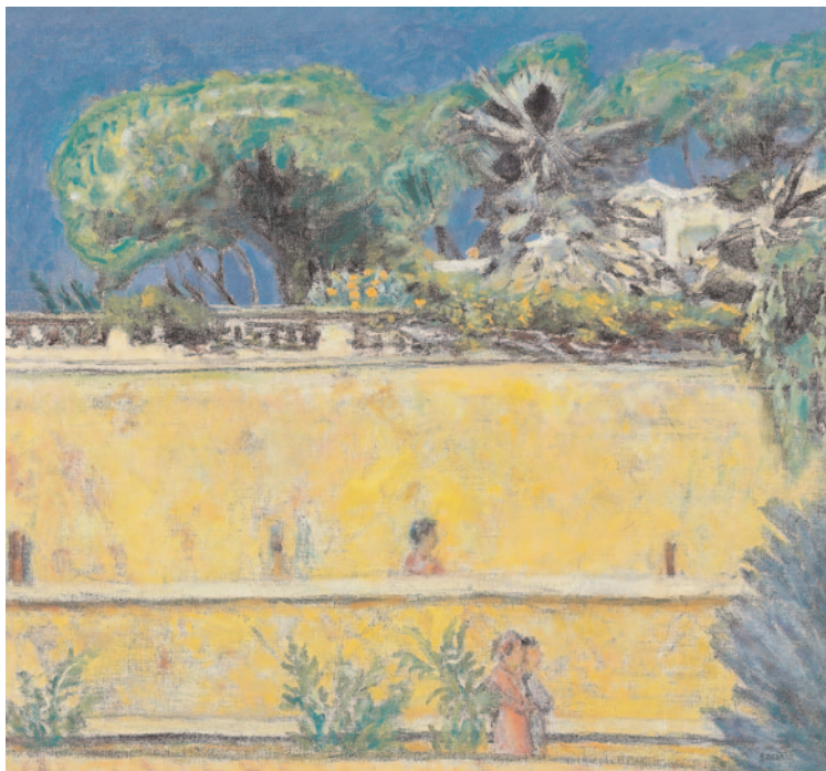
Pierre Bonnard (1867-1947), »Terrasse in Südfrankreich«, um 1925, Öl auf Leinwand, 78 x 63 cm, Collection Fondation Glénat, Grenoble