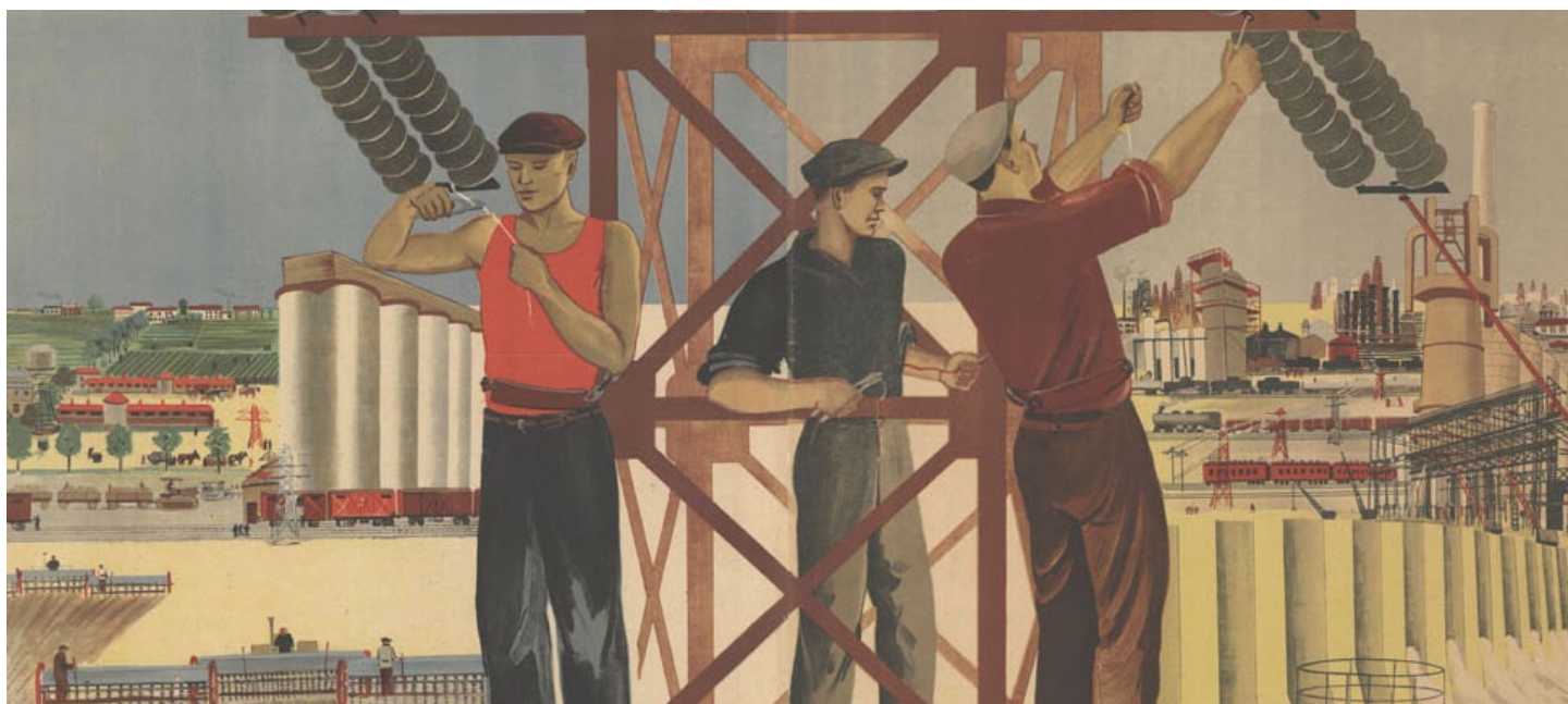
Bild: Let's consolidate the victory of socialism in the USSR! von IISG via Flickr - CC BY 2.0