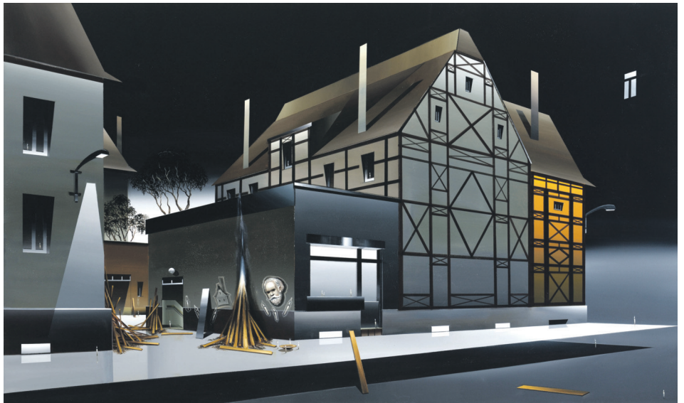
Titus Schade »Der Kiosk«, 2012, Öl und Acryl auf Leinwand, 100 x 170 cm, Privatsammlung, Foto: Uwe Walter, Berlin/VG Bild-Kunst Bonn, 2018

Titus Schade arbeitet mit einem Bildkosmos, der sich aus Architektur und inszenierten Bil-