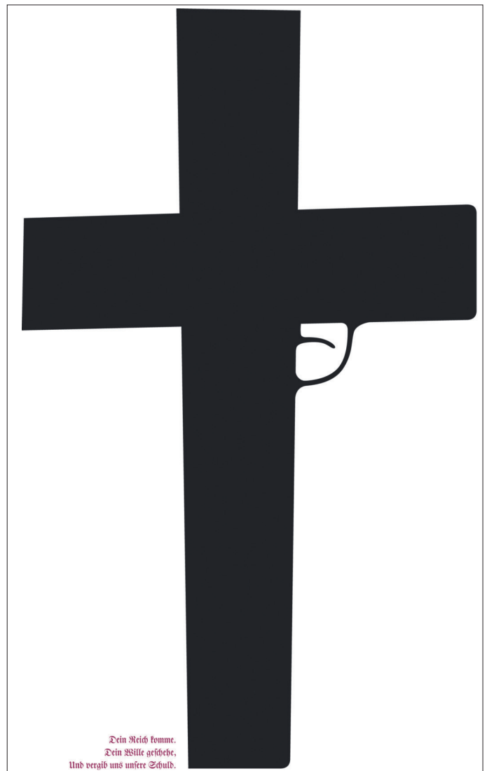
2. Leipziger Plakatpreis 2018