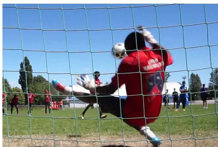
Bild rechts unten: Ende Juni hatte die Initiative „Weltoffenes Gohlis“ in Kooperation mit dem Team Nord der Streetworker der Stadt Leipzig, dem Roter Stern 99 e.V. und dem Bürgerverein Gohlis e.V. zum erneut ein Fußballturnier veranstaltet (siehe Artikel unten auf dieser Seite).

Bild rechts oben: DIE LINKE macht sich in Sachen Soziale Beratung fit, um künftig selbst in ihren Büros Grünau und Gohlis sozial-beratend tätig zu werden. Im Bild: Ein Workshop vom 7. August.