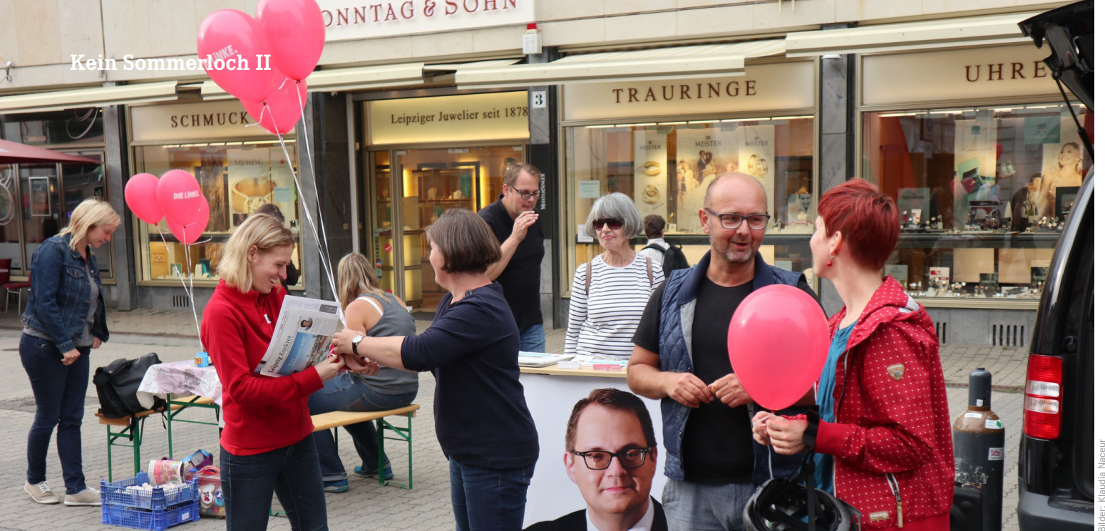
Bilder: Klaudia Naceur