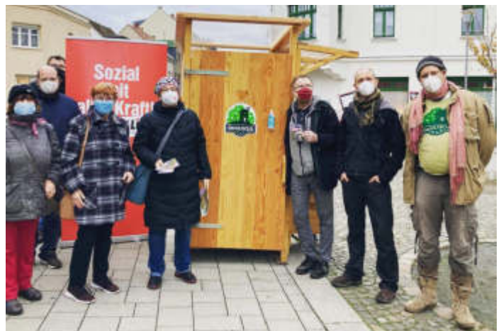
Bild links unten: Am 11.12.21 ist der Eiffelturm-Tag! Als DIE LINKE fühlen wir uns dem Pariser Klimaabkommen und dem 1,5°-Ziel verpflichtet und haben deswegen auch gern den Eiffelturm von Fridays for Future Leipzig entgegengenommen. Wir müssen die Klimakrise endlich anpacken und das sozial-gerecht!

Bild rechts unten: Am 6.12.21 begann unsere alljährliche Verteil- und Steckaktion zum Jahreswechsel. Diese steht 2021 unter dem Motto: "Schöne Feiertage und ein gesundes neues Jahr! Den Pflegekräften und Verkäuferinnen viel Kraft und einen guten Lohn."