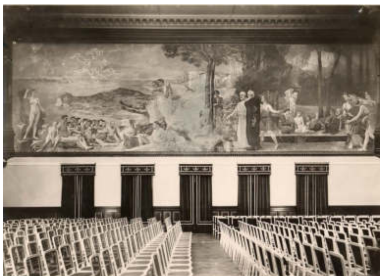
Max Klinger: „Die Blüte Griechenlands“, 1909, Wandbild in der Aula der Universität Leipzig, um 1925

Wer noch mehr von der Entstehungsgeschichte des verlorenen Wandbildes und seiner Wegbegleiter erfahren möchte, sollte sich den Katalog (Passage Verlag Leipzig, 146 Seiten, gebunden, 17,50 Euro) kaufen oder schenken lassen. Eine wunderbare Lektüre für winterliche Wochen. Und dann unbedingt nach Wiedereröffnung in die Ausstellung gehen!