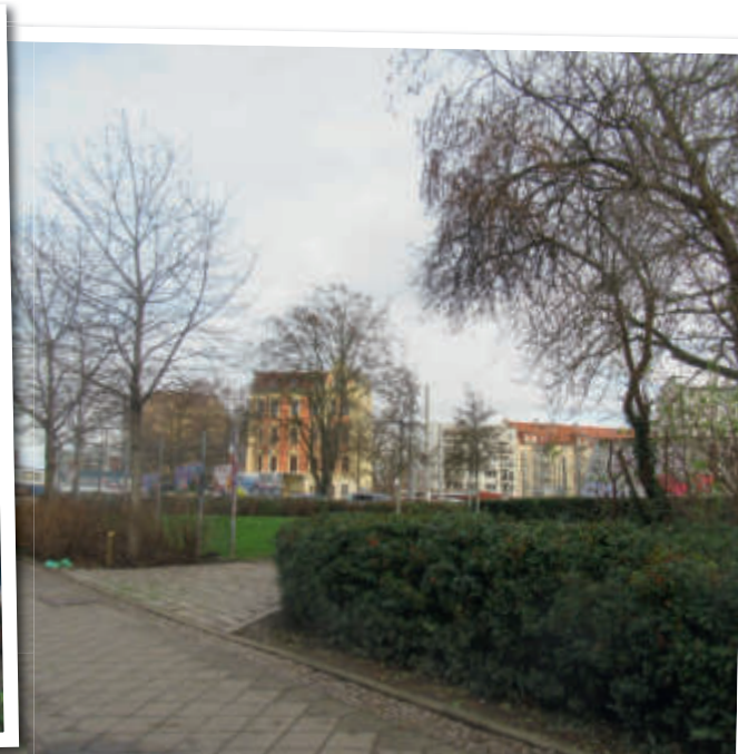
Areal Künftiges Wohnprojekt Wolfgang-Heinze-Straße 29 mit 42 Wohnungen, davon 50% Sozialwohnungsanteil in Connewitz-Biedermannstr.