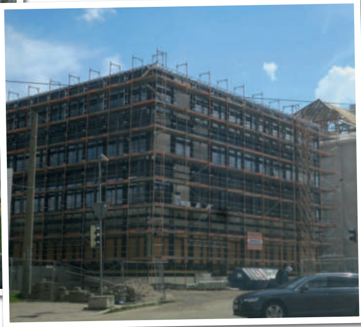
Beide Fotos: Städtebaufördermittel für Umfeld Schulcampus Ihmelsstr., Gymnasium und Oberschule

in teilweise desolaten Altbauten. Nach der Gebäudesicherung, vor allem der Dächer und Fassaden, wurden bei 37 von 44 Gebäuden Städtebaufördermittel eingesetzt. In der Folgezeit wurden umfassende Modernisierungs- und Instandsetzungsmaßnahmen bezuschusst. In der nächsten Erneuerungsphase ging es vor allem um die Aufwertung der öffentlichen Straßenräume sowie des privaten Wohnumfeldes, durch mehr Grün und weniger Bebauungsdichte. Im Sanierungsgebiet Prager Straße gab es einen Mangel an öffentlichen Spielplätzen und wohnungsnahen Grünflächen. Durch Abriss verschlissener Hinterhausbebauung und mit Hilfe von Fördermitteln konnten grüne Hofbereiche gestaltet werden. Auch öffentliche Straßenräume der Wohngebietsstraßen wurden mit Städtebaufördermitteln neu gestaltet. Es wurden Straßenbäume gepflanzt und die Fahrbahnen wurden mit begleitenden Parkstellflächen sowie Gehwegen neu geordnet und gestaltet. Das war in größerem Umfang finanzierbar, weil vorzeitig von den Gebäudeeigentümern Ausgleichszahlungen abgelöst wurden. Durch die zu DDR-Zeiten begonnene und nach 1990 weitergeführte städtebauliche Bebauungsplanung wurde die neue Messemagistrale grundhaft ausgebaut. Entlang der von ehemals 14 m auf 38 m verbreiterten Prager Straße wurden die Straßenbahnschnelltrasse separiert, und Radwege, attraktive Fußwege sowie Vorbeete gebaut. Auf neu ausgewiesenen Grundstücken entstanden Gebäude mit bis zu 8 Geschossen, darunter eine Studenten-