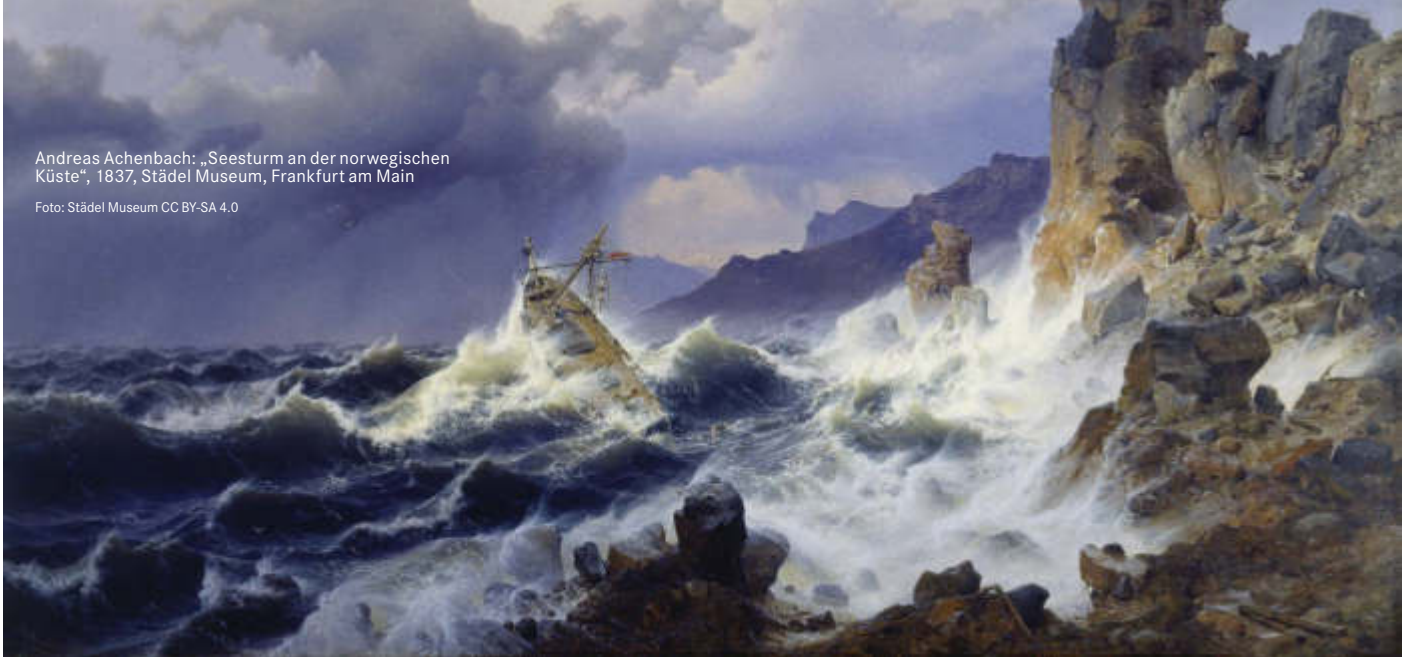
Andreas Achenbach: „Seesturm an der norwegischen Küste“, 1837, Städel Museum, Frankfurt am Main