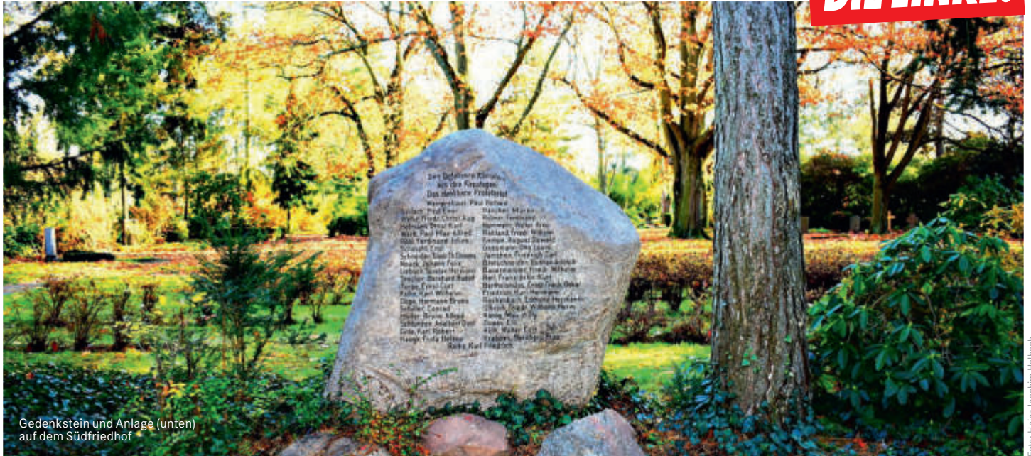
Gedenkstein und Anlage (unten) auf dem Südfriedhof