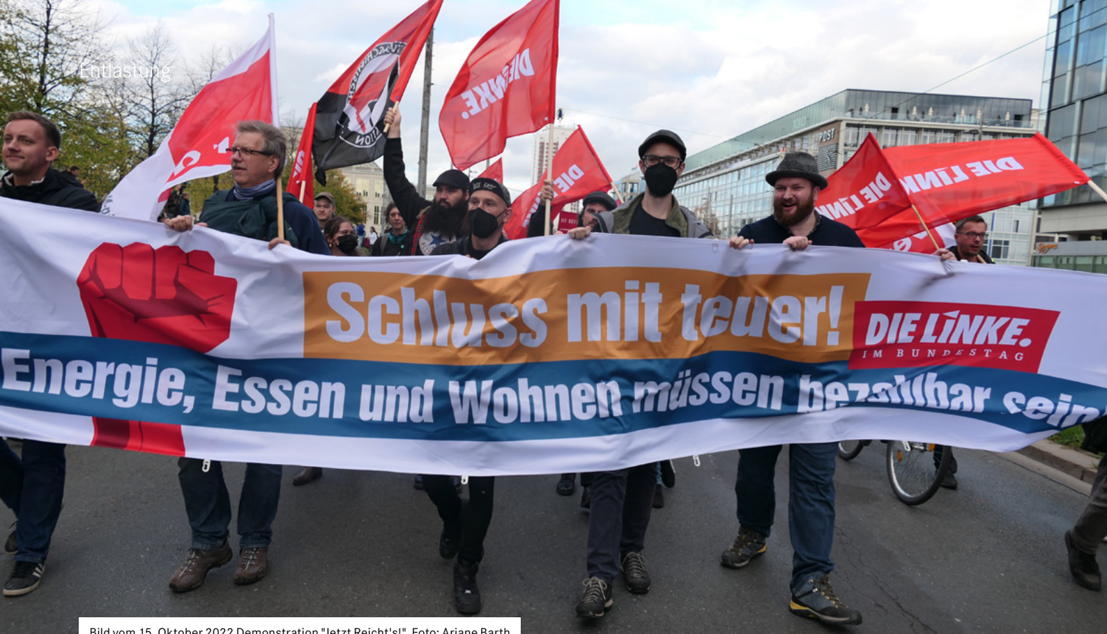
Bild vom 15. Oktober 2022 Demonstration "Jetzt Reicht's!"