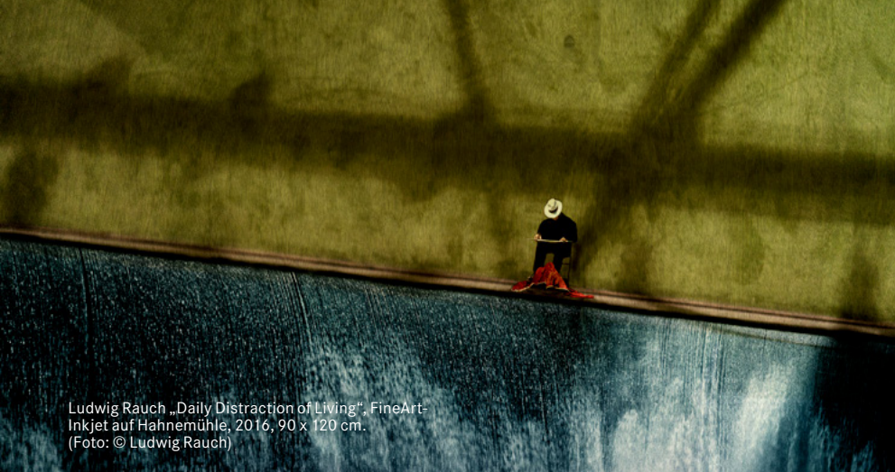
Ludwig Rauch „Daily Distraction of Living“. FineArt- Inkjet auf Hahnemühle, 2016, 90 x 120 cm.

Das raffinierte an der Ausstellung ist, dass die Porträtierten auf der gleichen Etage im Museum mit ihren eigenen Kunstwerken vertreten sind. So ist auch das Werk „Bildnis Peter Beckmann“ (1990) von Bernhard Heisig ein paar Räume weiter zu finden. Einige Porträts sind im Zuge der aktuellen Leipziger Ausstellung entstanden und weisen damit in die Gegenwart hinein.