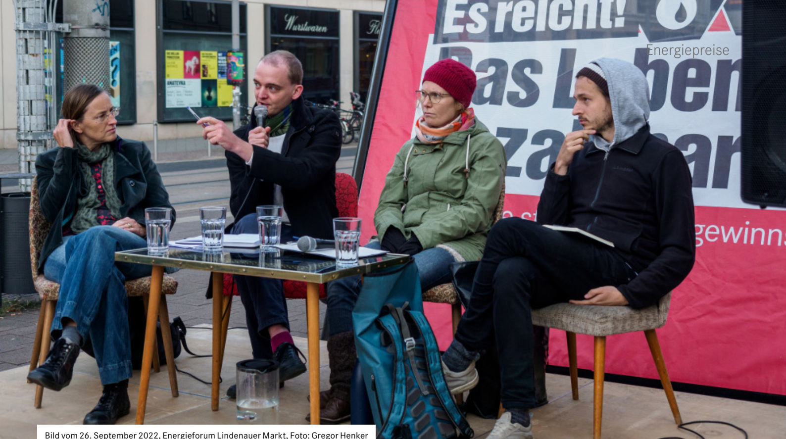
Bild vom 26. September 2022, Energieforum Lindenauer Markt, Foto: Gregor Henker