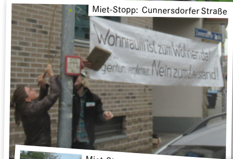
Miet-Stopp: Cunnersdorfer Straße