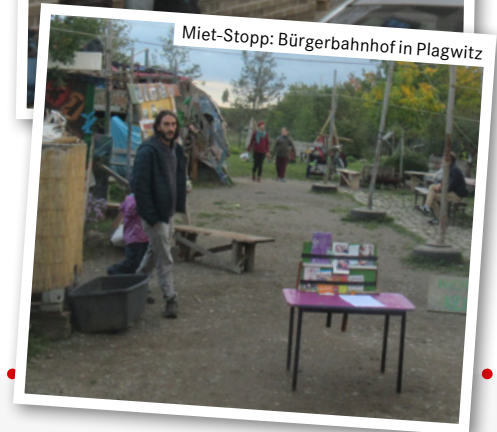
Miet-Stopp: Bürgerbahnhof in Plagwitz

nes zählen Ringens bedurfte wie bei den Geländern am Haupteingang zum Neuen Rathaus oder einen Lift im Fußgängertunnel am Hauptbahnhof gesehen. Ein Antrag des Behindertenbeirates fordert erneut und nachdrücklich eine lückenlose Barrierefreiheit in öffentlichen Gebäuden und baulichen Anlagen. Anlass war ein fehlender Einbau eines Aufzugs bzw. Rampe im kürzlich fertig gestellten umgebauten Aquarium. Zukünftig muss die Barrierefreiheit für Architekten und Planer trotz Selbstverständlichkeit zwingend vorgegeben werden. Auch darf Denkmalschutz kein k.o. - Kriterium sein. Vielmehr muss gemeinsam nach Lösungen gesucht werden, wie etwas geht, statt zu begründen, was, warum nicht geht. Dabei sind bedarfsweise auch das Gesundheitsamt, die Behindertenbeauftragte und/oder der Behindertenbeirat einzubeziehen.