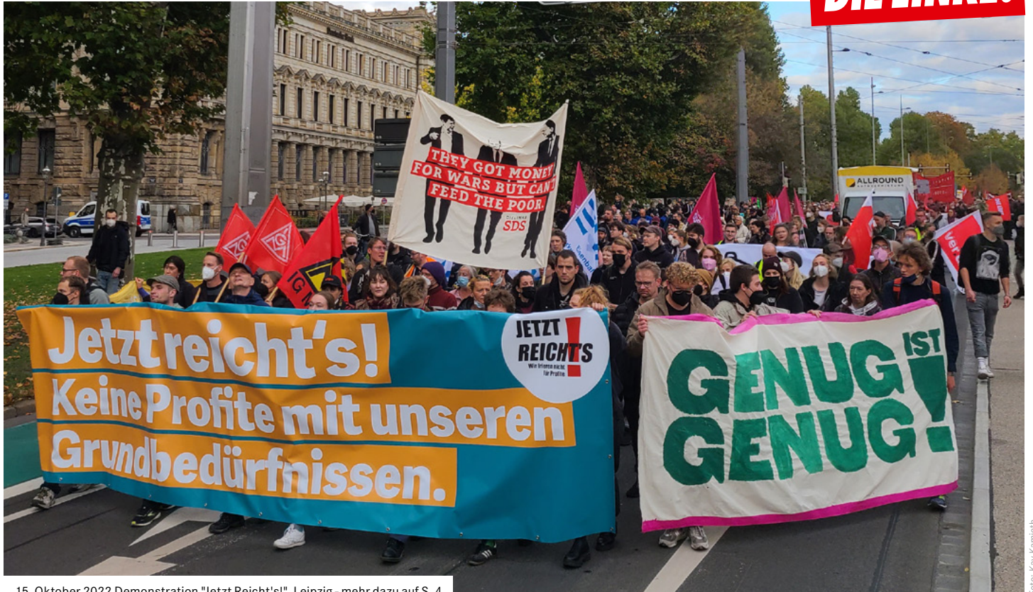
15. Oktober 2022 Demonstration "Jetzt Reicht's!", Leipzig - mehr dazu auf S. 4